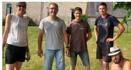
Mise en place des tables de pique nique réalisées par les bénévoles en 2022