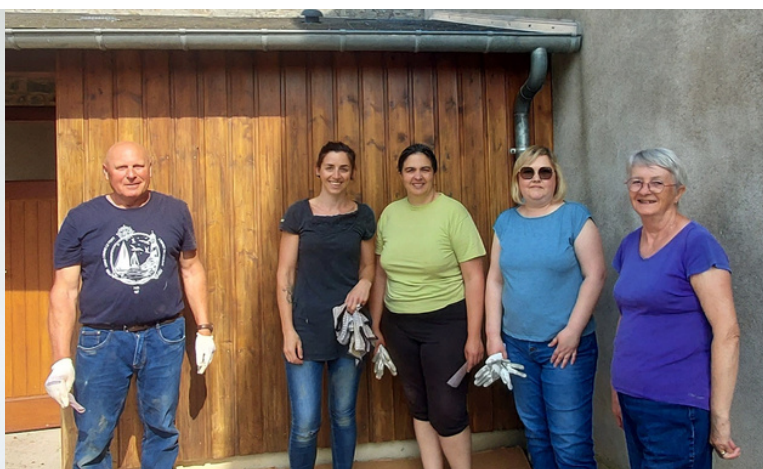
Cantine repeinte, lasure local poubelle, lasure toilettes mairie et radiateurs Maison pour tous et salle club repeints :