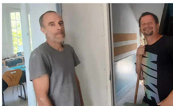
Mise en place d'une cloison à l'atelier des possibles