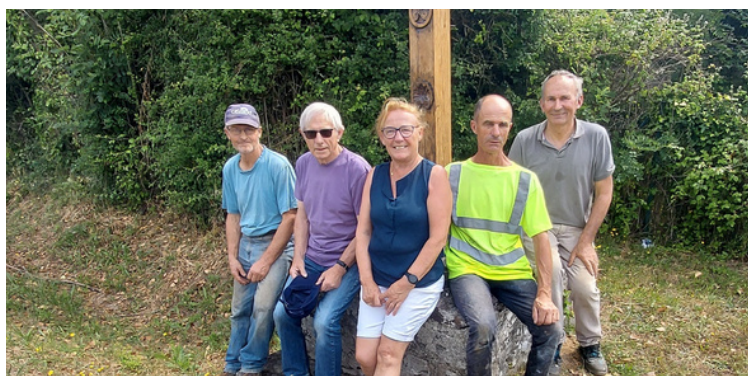
Remise en place de la croix rue Jules Ferry après réfection.