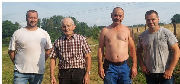
La clôture des lagunes est terminée

Je tiens à remercier sincèrement tous les participants pour leur implication et bonne humeur; Cette journée permet la réalisation de nombreux travaux et est un lien social indéniable permettant aux habitants de se rencontrer: une très belle journée.